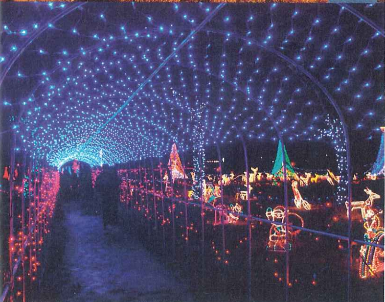
上: わたらせ渓谷鐵道 (みどり市) 下: 榛名湖イルミネーション (高崎市)